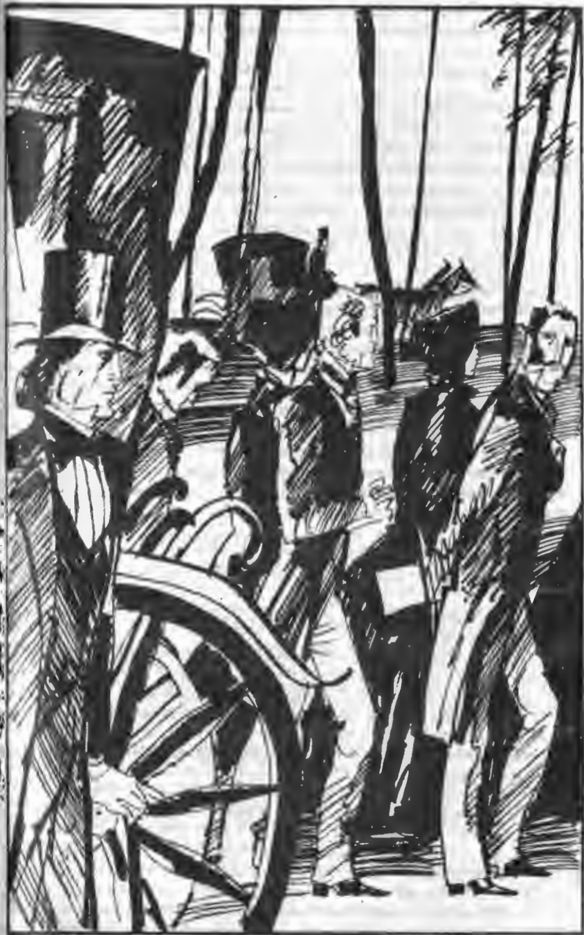
Illustration of a group of men in 19th-century attire, possibly a scene from a play or a historical event.