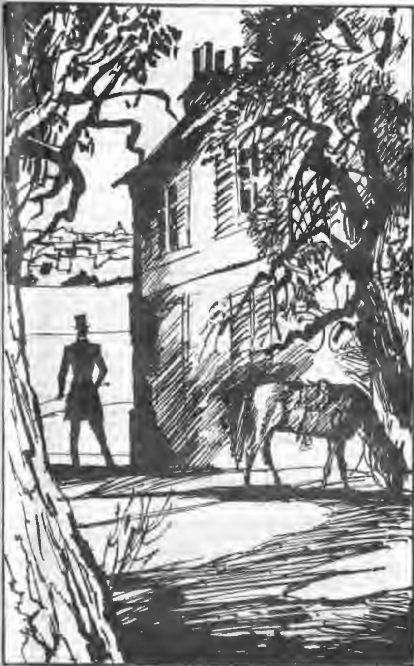
THE MAN WHO STOOD IN THE COURTYARD